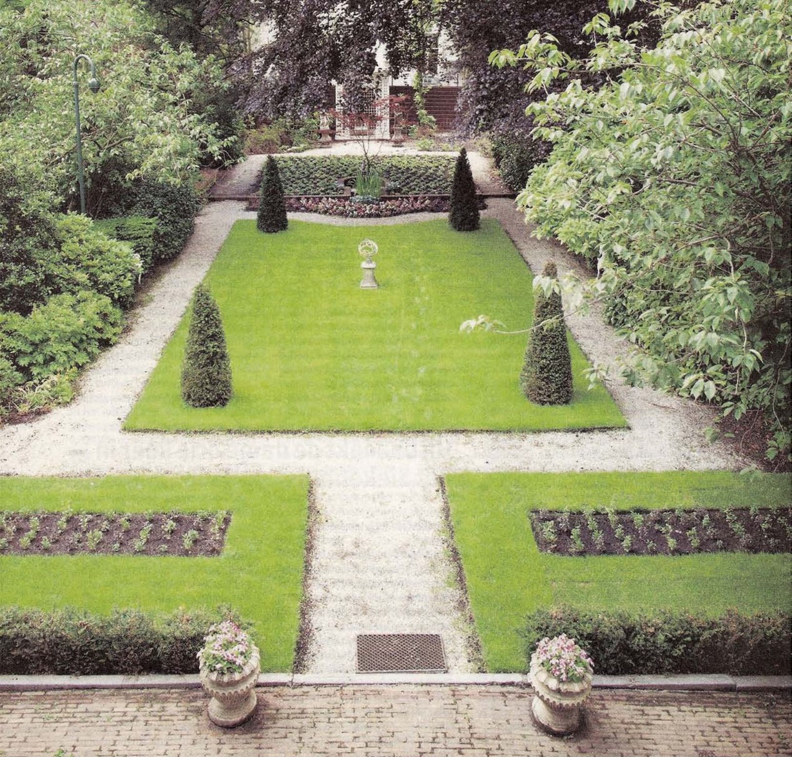
De burgemeesterstuin gezien vanaf het balkon van de ambtswoning.