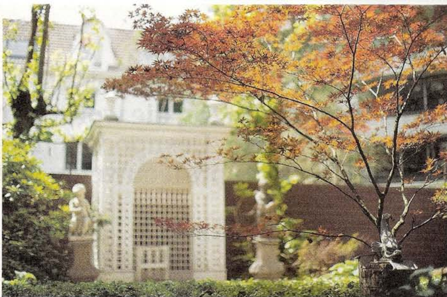
Het prieeltje achterin de tuin.